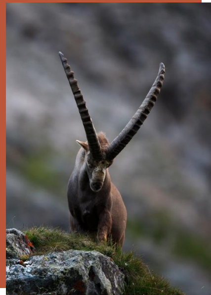
Le Bouquetin des Alpes