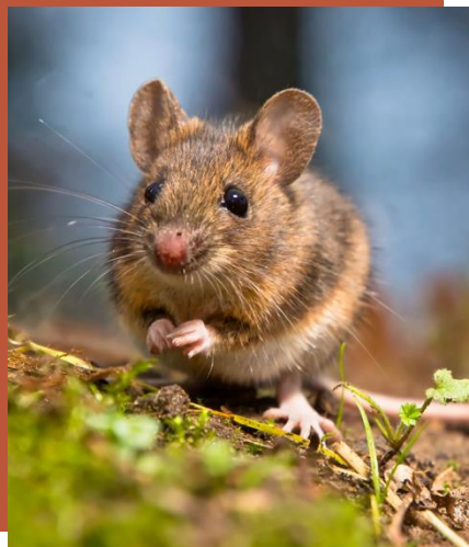
Le Mulot Alpestre