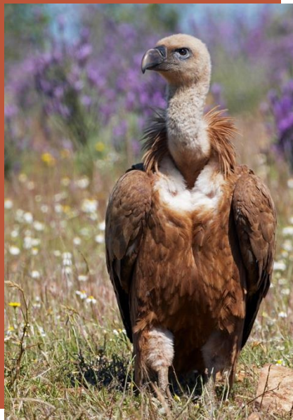
Le Vautour Fauve